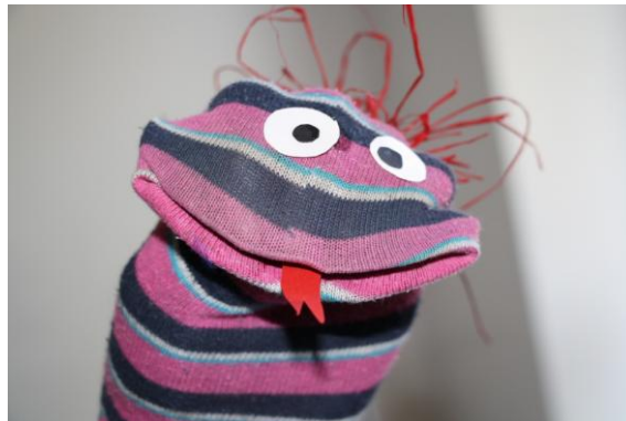
Foto: Das allgemeine geringelte Sockentier.